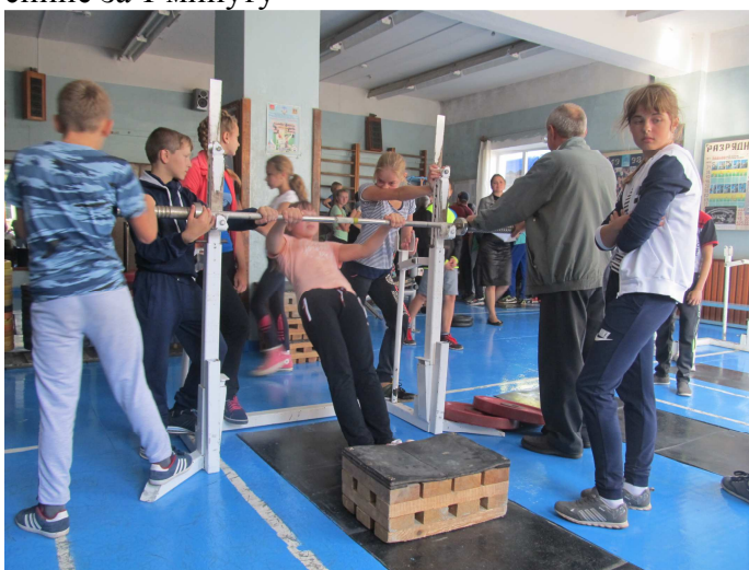
Подтягивание из виса лежа на низкой перекладине