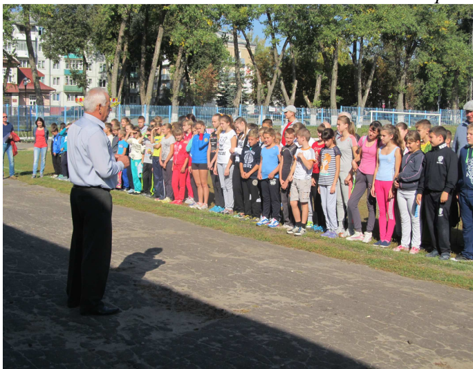
Построение перед началом фестиваля