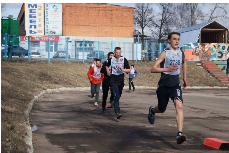
Бег на 3000 м.