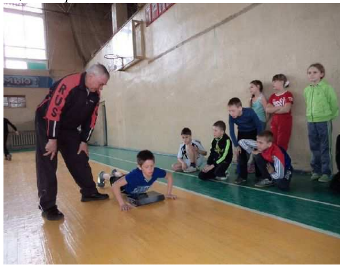
Сгибание и разгибание рук в упоре лежа на полу