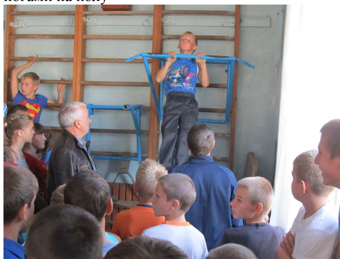
Подтягивание из виса на высокой перекладине