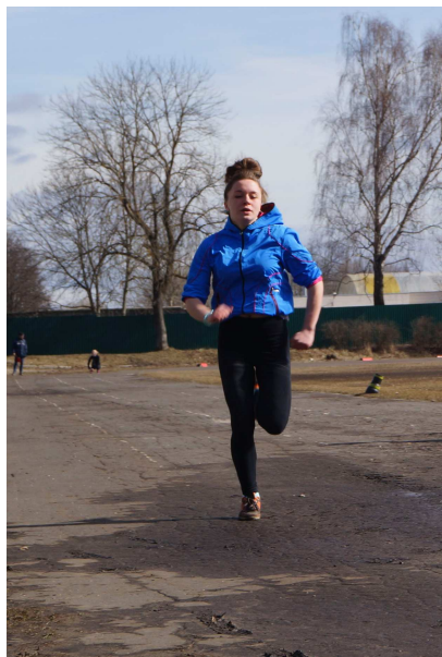
Бег на 100 м.