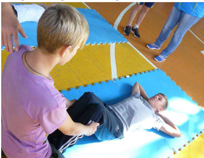
Поднимание туловища из положения лежа на спине за 1 минуту